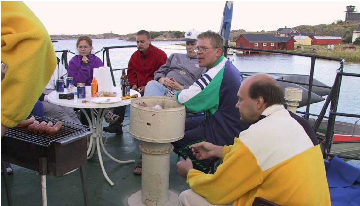
Afterdive menossa Orbiitin takakannella.