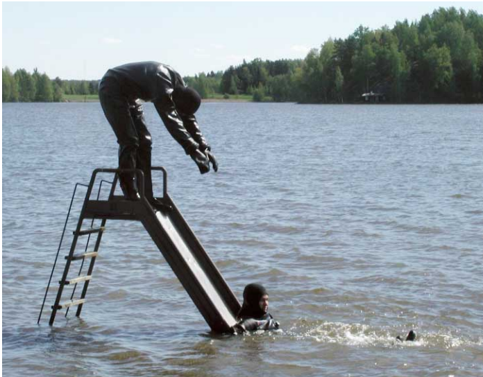
Vesilahden siivoustalkoot lähestyvät. Vuonna 2001 testattiin mm. liukumätkien turvallisuus. Kiva A Tauschi.