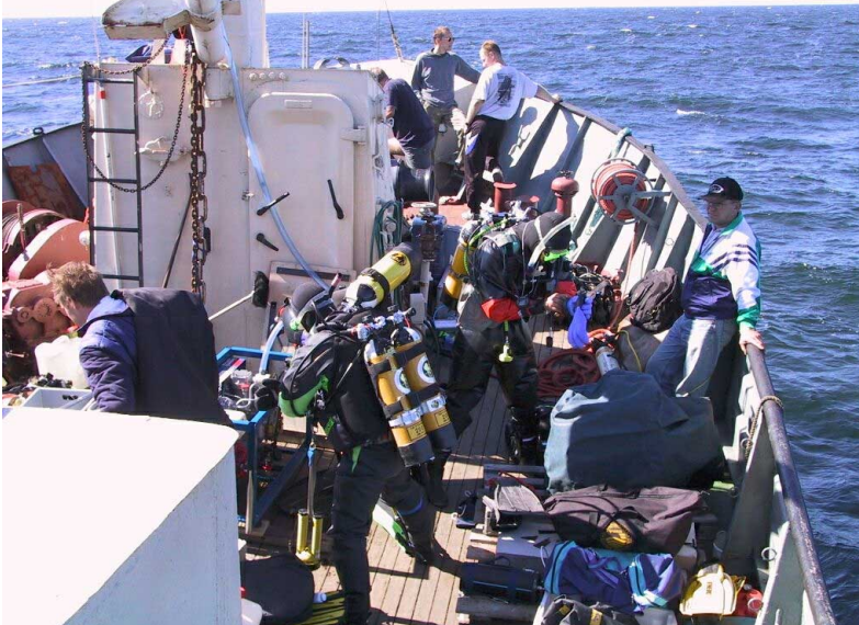
Säpinää Orbitin kannella sukellustoiminnan aikana. T.J.