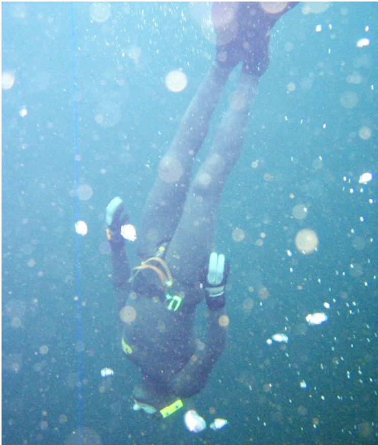
Kimmo matkalla syvyyksiin.