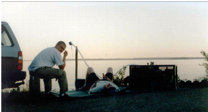
Kesä tuloo!! Pullon täyttöö kesäillassa. Kuva ??