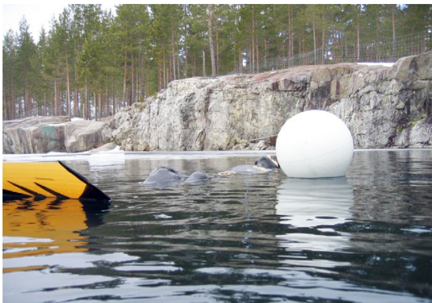
Vapaasukeltaja pääsiäisenä Kaatialassa jäiden seassa.