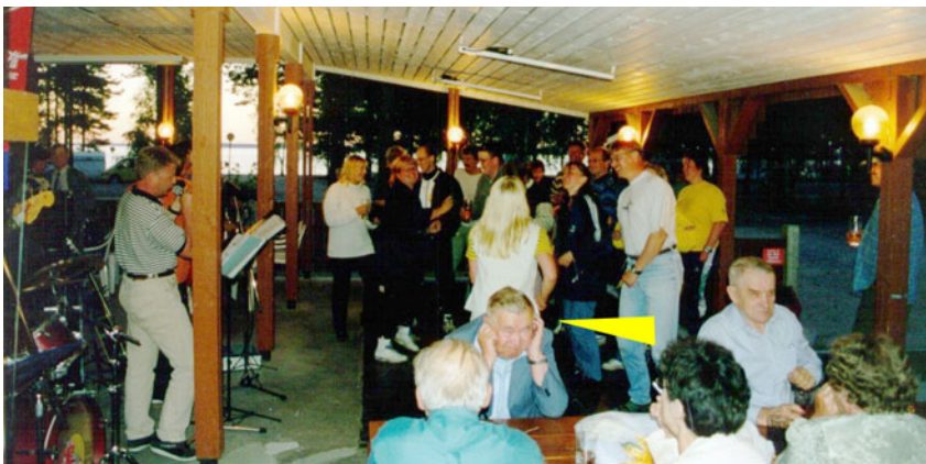
1999 leiriläiset muistanevat tämän performansen. Kuva ??