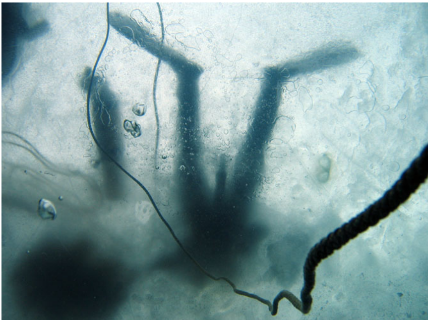
Kuvassa Ville altapäin Kaatialassa.