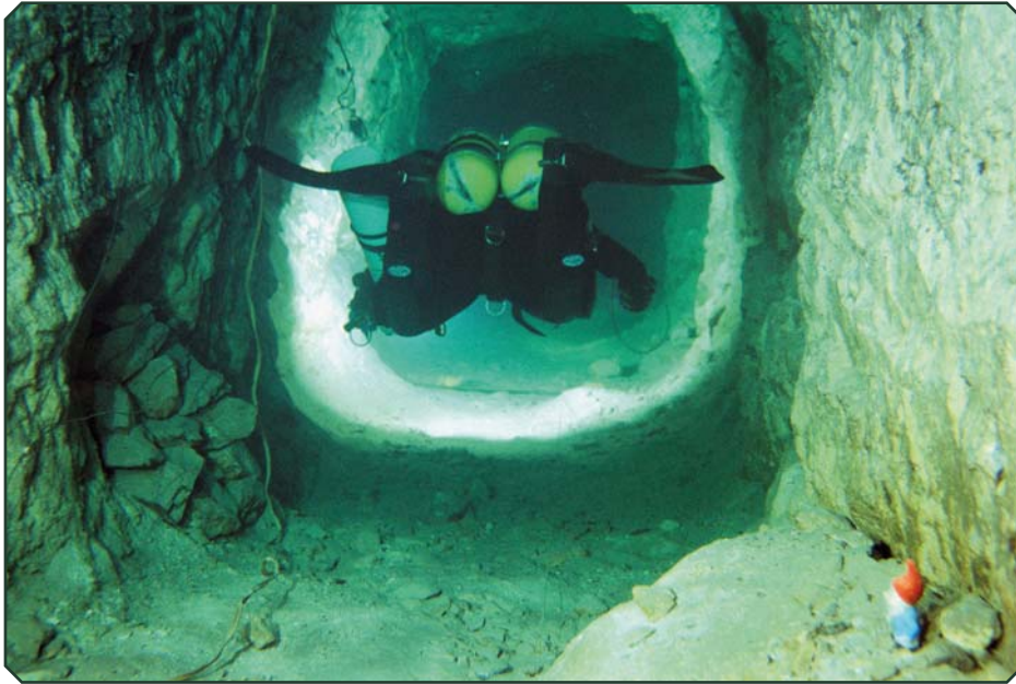
Mariokäytävän tonttu-ukko ihmettelee omituista otusta.

metriä. Matkalla muutama tienhaara vasemmalle, joista pääsisi muihin K-halleihin. Arviolta 100 metrin uinnin jälkeen tulee vastaan ensimmäinen droppi, käytävä kääntyy tiukasti vasempaan ja putoaa pystysuoraan kolmisen metriä. Manööveri on hankala ensikertalaiselle, etenkin kun kääntäessä joutuu varomaan kurvissa kattoon nousevaa opasnuoraa. Syvyys on nyt 42 metriä ja uinti jatkuu. Lasinkirkkaan veden ja runsasheliumisen hengityskaasun johdosta erotan yksityiskohdat niin kirkkaasti ja terävästi että silmiin melkein sattuu, ihan kuin olisi aurinkoisena kesäpäivänä uudet silmälasit päässä. Matkan edetessä ja