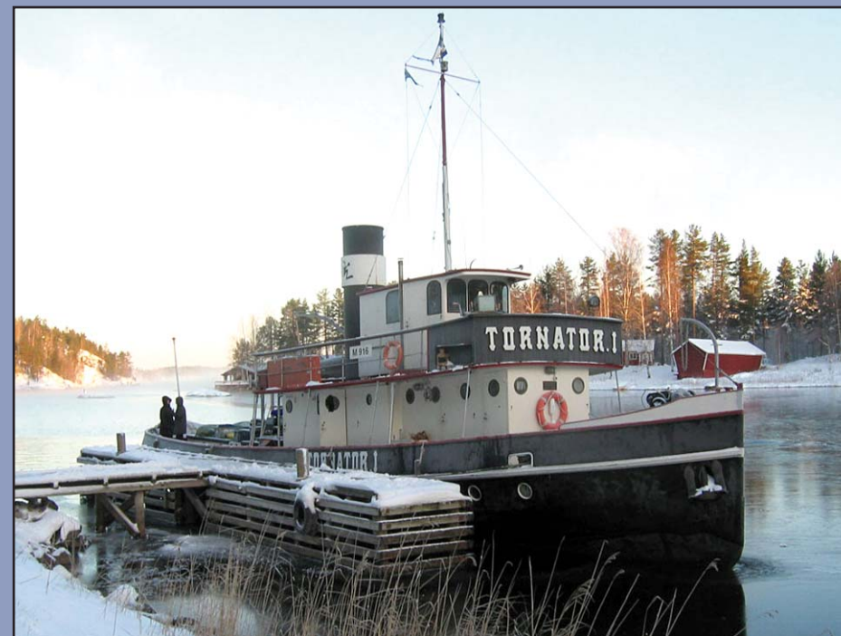
Tornator I, uskollinen työjuhta.