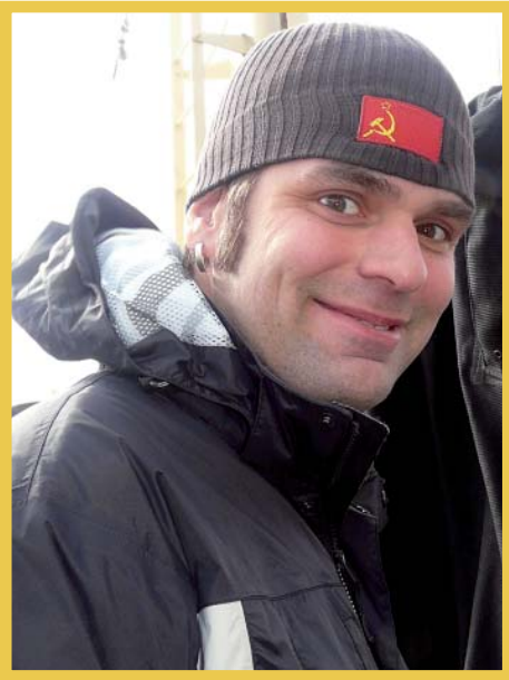
Matkanjohtaja Tyven maanisen tyytyväisenä.

”En olisi uskonut, että tästä kaupungista on näin vaikea päästä pois!” Seisoimme perjantai-iltapäivän ruuhkassa Mikun ääriin myöten täyteen lastatussa pakettiautossa laskien minuutteja Woikosken sulkemiseen. Lopulta oli pakko tunnustaa tosiasiat ja unohtaa tyhjen happitankkien vaihtaminen täysiin. Onneksi Kammiolla oli vielä yksi vajaa happitankki, jonka avulla saataisimme selvitä reissun kaasutäytöistä. Matkaan päästiin siis tunti suunnitellusta myöhässä.